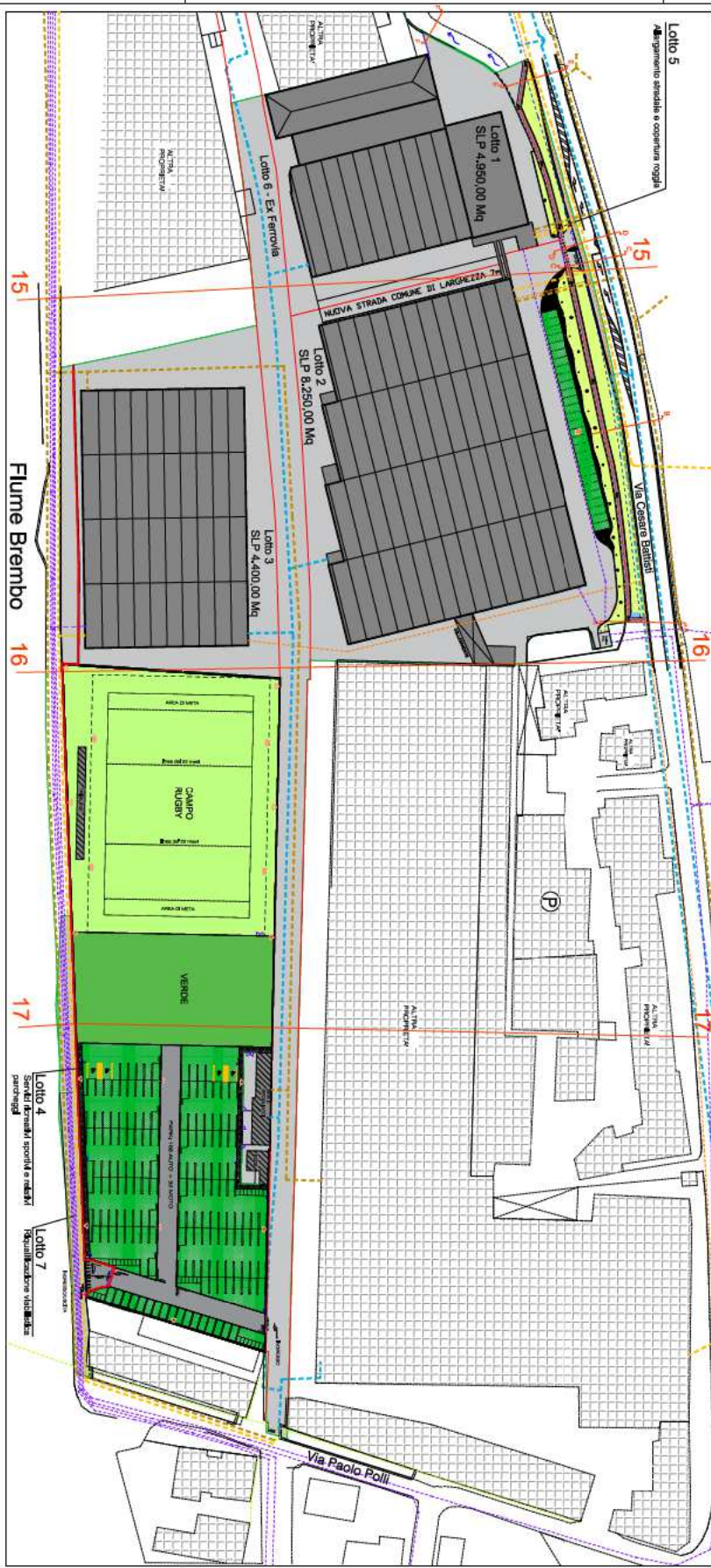
PLANIMETRIA GENERALE STATO DI PROGETTO scala 1:500